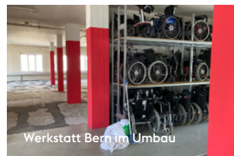
Werkstatt Bern im Umbau