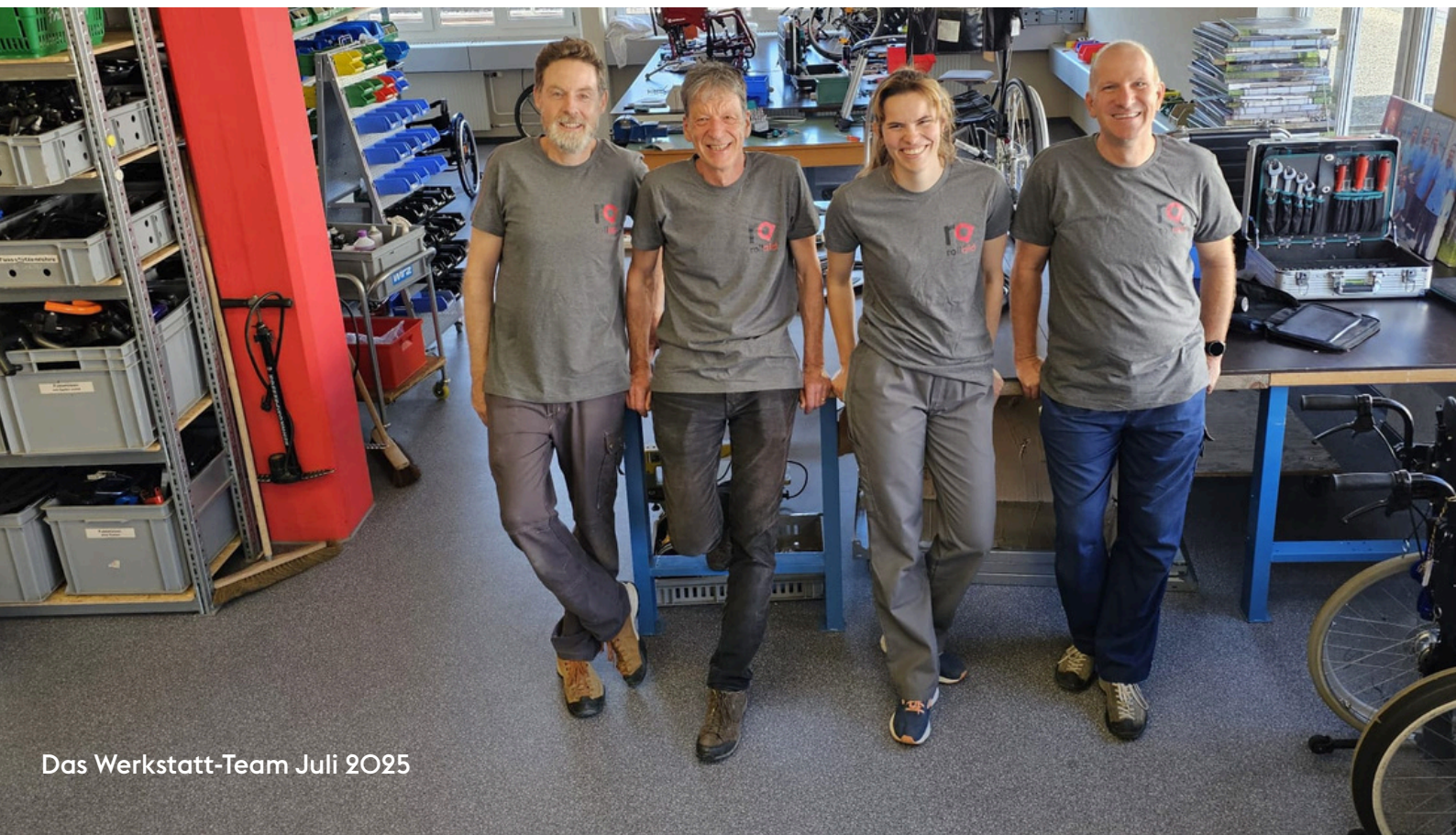
Das Werkstatt-Team Juli 2025

Das Sammeln und Verteilen der Hilfsgüter läuft seit Jahren auf hohem Niveau absolut problemlos. Auf der einen Seite pflegen wir gute Kontakte mit Hilfsmittelstellen und Firmen, die uns das Material zur Verfügung stellen und auf der andern Seite ist der Bedarf an unseren bestens revidierten und einsatzbereiten Mobilitäts- und Therapiehilfen gross. Für die wunderbaren Kooperationen danken wir sehr herzlich.