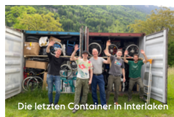
Die letzten Container in Interlaken