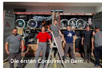
Die ersten Container in Bern